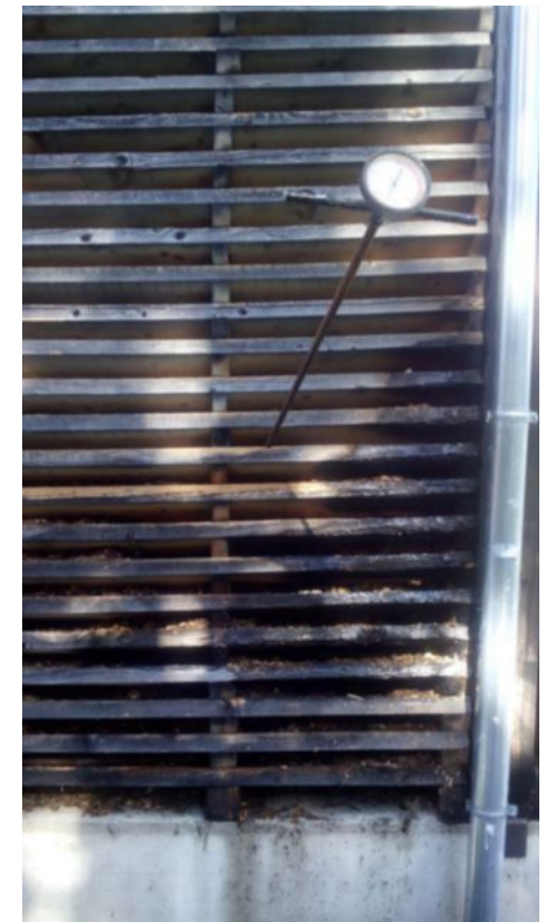
FF St. Ulrich a.P.