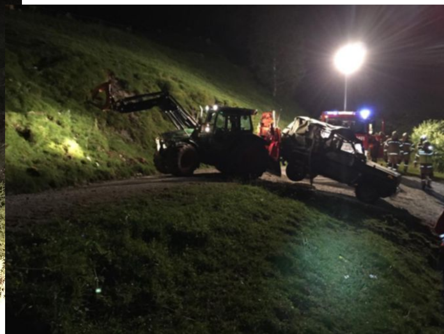
FF St. Ulrich a.P.