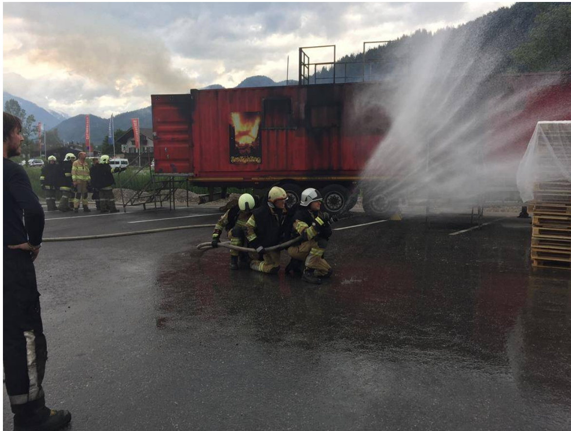
FF St. Ulrich a.P.